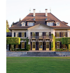
Swiss Re Centre Villa