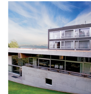
Swiss Re Centre for Global Dialogue