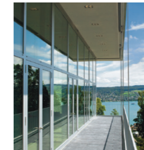
Perfekte Konferenzlokaltäten im GDI