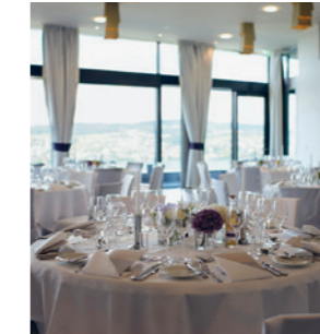
Pre-Event/Dinner im Hotel Belvoir

Save the Date: Pre-Event/Dinner 15. Mai 2019 / Senior Executive Konferenz 16. Mai 2019