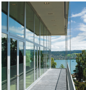
GDI Gottlieb Duttweiler Institute